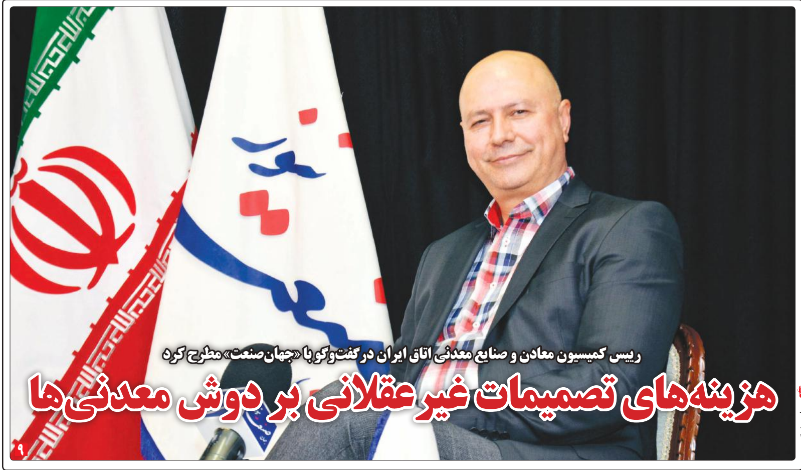
رئیس کمیسیون معادن و صنایع معدنی اتاق ایران در گفت‌وگو با «جهان‌صنعت» مطرح کرد